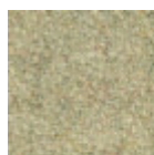
Tessuto Fenix Wool