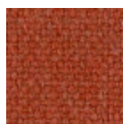
Tessuto Cotton Club