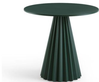
Table bistro Plissé H73