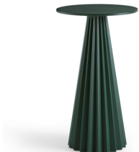
Table bistro Plissé H103