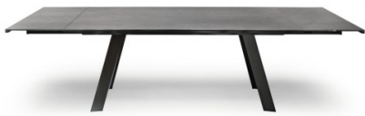
Table extensible Alexander